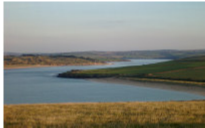
Bilder från en muslimsk systems hemstad

Allaah är Skaparen (Al-Khaliq). Han har skapat allting. Han har skapat paradiset, och jorden. Allaah har skapat himmelen som du ser ovanför dig. Han har skapat sju himlar ovanför oss, en ovanför den andre. Han har även skapat sju jordar. Nu kan vi inte se himlarna, utan endast se en, resten är ovanför. Vi kan inte se från de andra jordarna utom den som vi lever på.